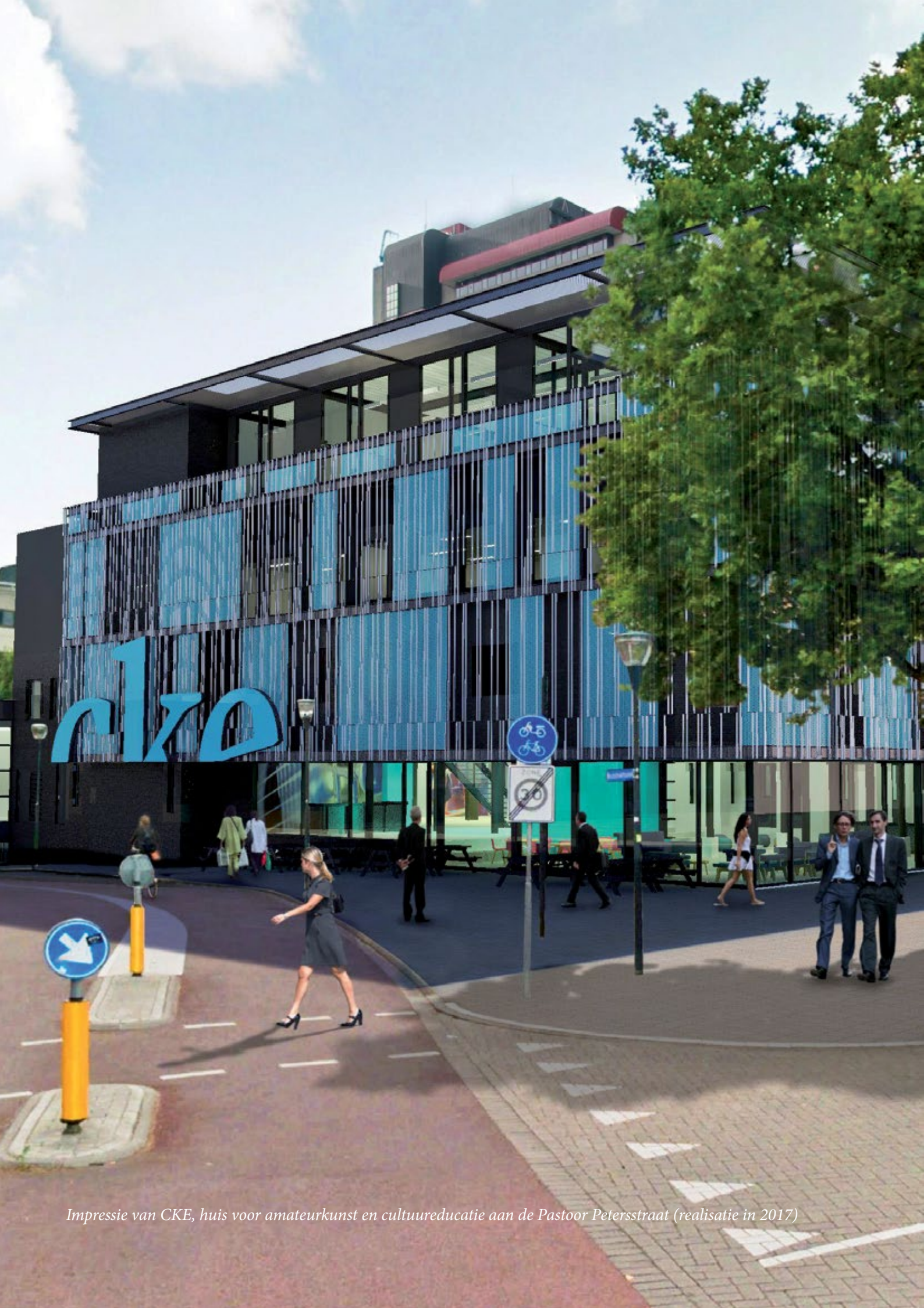
Impressie van CKE, huis voor amateurkunst en cultuureducatie aan de Pastoor Petersstraat (realisatie in 2017)